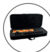
ELEKTRONISCH € 690,00