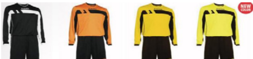
Uitrusting lange mouw + kousen: 45 euro