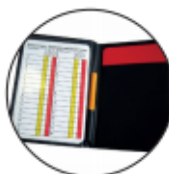
NOTITIEBOEK € 7,00