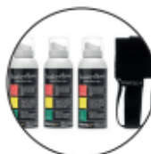
VANISHING SPRAY € 8,00