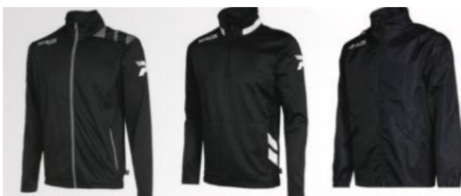
Trainingsjas: 20 euro