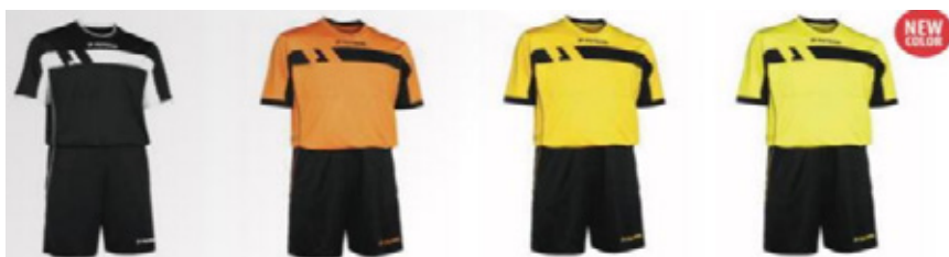
Uitrusting korte mouw + kousen: 40 euro