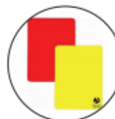
SET KAARTEN € 2,50