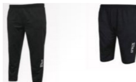
Trainingsbroek: 14 euro