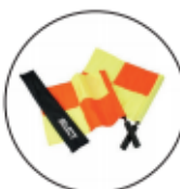
SET VLAGGEN € 30,00